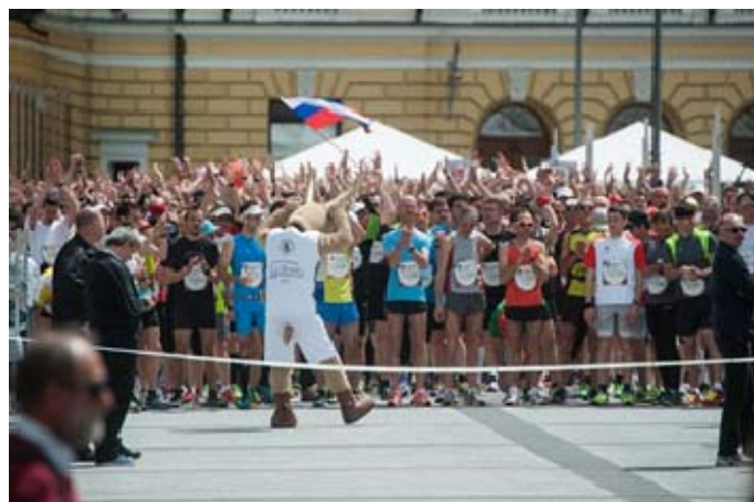
Na fotografiji: štart teka

V Sloveniji je zmagal tekač, ki je pretekel 59 km, absolutni svetovni zmagovalec pa je pretekel 78 km. Tekmovanja sem se udeležil tudi jaz in pretekel 36 km.