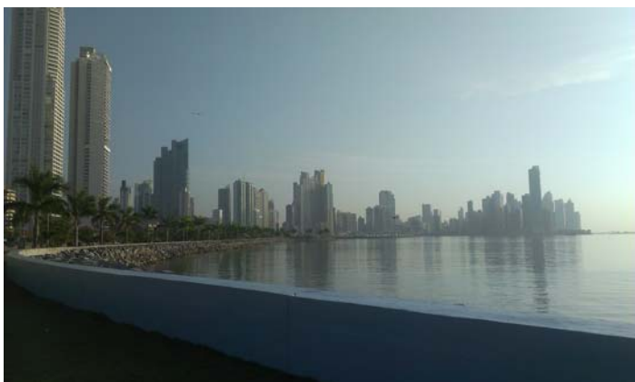
Na fotografiji: mesto Panama

Trajanje projekta je časovno opredeljeno na obdobje od decembra 2010 do decembra 2014. V dosedanjem obdobju trajanja projekta je bilo vključenih 36 udeležencev usposabljanja, od tega je bilo v usposabljanje vključenih 11 žensk, oz. 2 mlajši osebi.